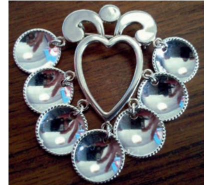
Silverbrosch tillverkad av Lavvo Sami Art & Nature.

Trots att dagens samiska silver kan vara både nyskapande och modernt går det att känna igen ett tydligt samiskt formspråk som funnits med från början, och som under snart 800 år har förfinats och kristalliserats till något unikt.